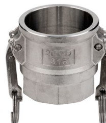
nerezová ocel AISI 316