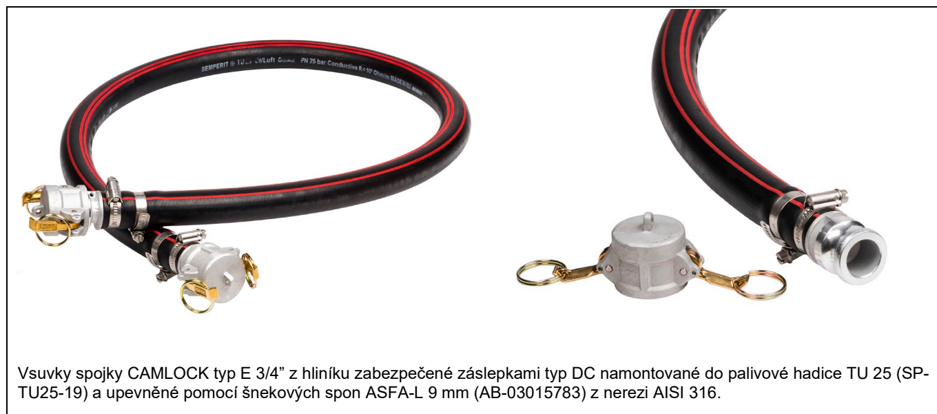
Vsuvky spojky CAMLOCK typ E 3/4" z hliníku zabezpečené zásepkami typ DC namontované do palivové hadice TU 25 (SP-TU25-19) a upevněné pomocí šnekových spon ASFA-L 9 mm (AB-03015783) z nerez AISI 316.

Poznámka: řetízek zámek je samostatná položka sortimentu.