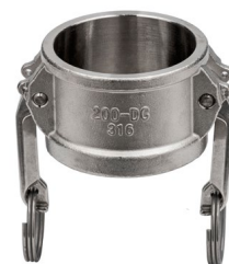
nerezová ocel AISI 316