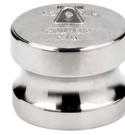
nerez AISI 316