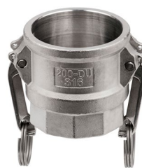
nerezová ocel AISI 316 (ploché těsnění z PTFE)