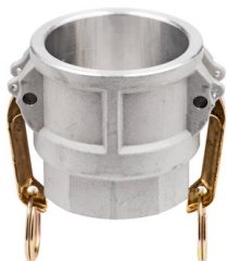
hliník (ploché těsnění z polyuretanu)