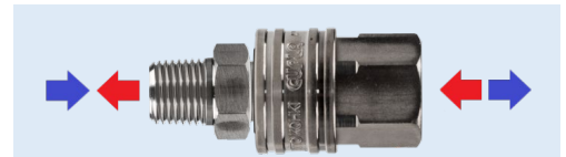
TSP CUPLA: průtok libovolným směrem

Univerzální bezventilové rychlospojky s volným průtokem, určené pro vodu, hydraulické oleje, chemikálie, páru, vzduch a plyny. Zvláště vhodné pro vysoce viskózní kapaliny, např. K dispozici ve velikostech od 1/8" do 2", nezaměnitelné. Široce používané v průmyslu.