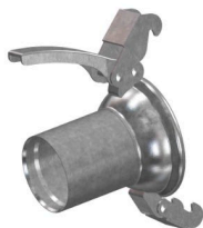
Spojka s koncovkou na trubku PE (polyetylen)