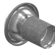
Vsuvka s koncovkou na trubku PE (polyetylen)