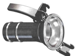
Redukční spojka s koncovkou na hadici