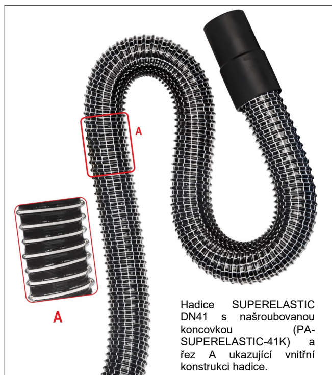
Hadice SUPERELASTIC DN41 s našroubovanou koncovkou (PA-SUPERELASTIC-41K) a řez A ukazující vnitřní konstrukci hadice.