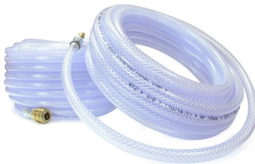
Hadicový komplet WTZ se spojkami Eurostandard DN7,2 na obou stranách