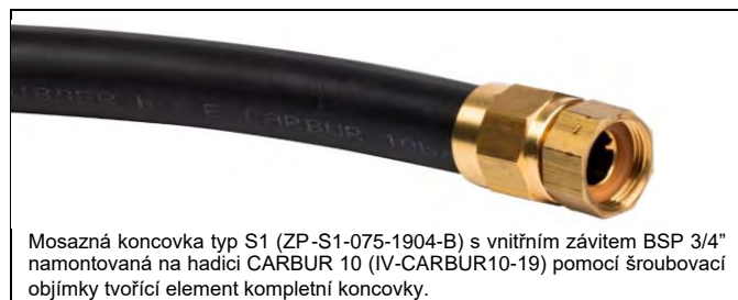
Mosazná koncovka typ S1 (ZP-S1-075-1904-B) s vnitřním závitem BSP 3/4" namontovaná na hadici CARBUR 10 (IV-CARBUR10-19) pomocí šroubovací objímky tvořící element kompletní koncovky.